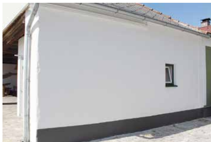
... und nach der Sanierung.