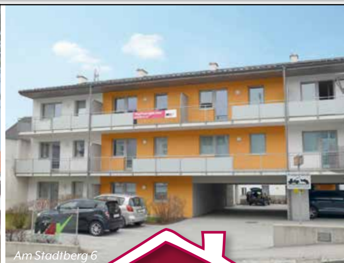
Am Stadtberg 6