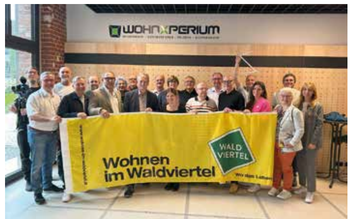
Die 20-köpfige Delegation der Vereine Interkomm und Wirtschaftsforum Waldviertel auf der Zukunft.Reise.Waldviertel im WohnXperium in Chemnitz