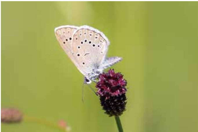
Heller Wiesenknopf-Ameisenbläuling

Auf den roten Blütenköpfchen konnten wir gemeinsam mit anderen Interessierten die rasenden Falter hervorragend beobachten. Nicht schlecht staunten wir, als wir dort eines Tages zum ersten Mal den Hellen Wiesenknopf-Ameisenbläuling entdeckten! Diese Schmetterlingsart ist nochmal um einiges seltener als sein Verwandter, der Dunkle Wiesenknopf-Ameisenbläuling. Wir hoffen, dass sich durch unsere Pflegemaßnahmen diese wunderschöne Rarität dort langfristig etablieren kann.