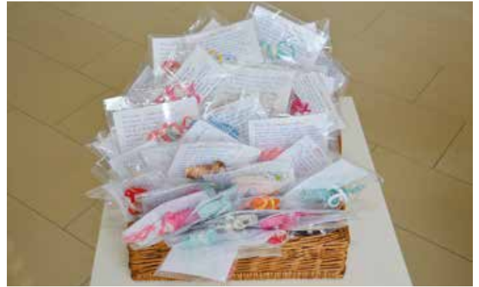
Ein Korb voller Glückswürmchen