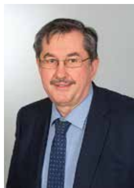
Vizebürgermeister Ewald Gamper