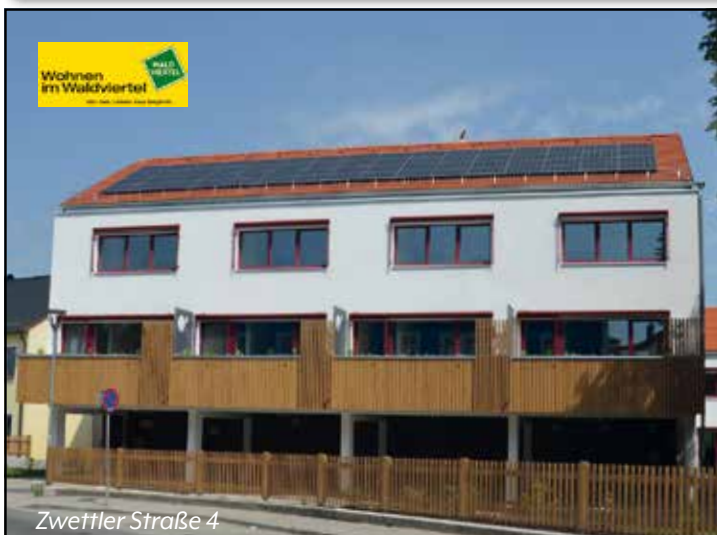
Zwettler Straße 4